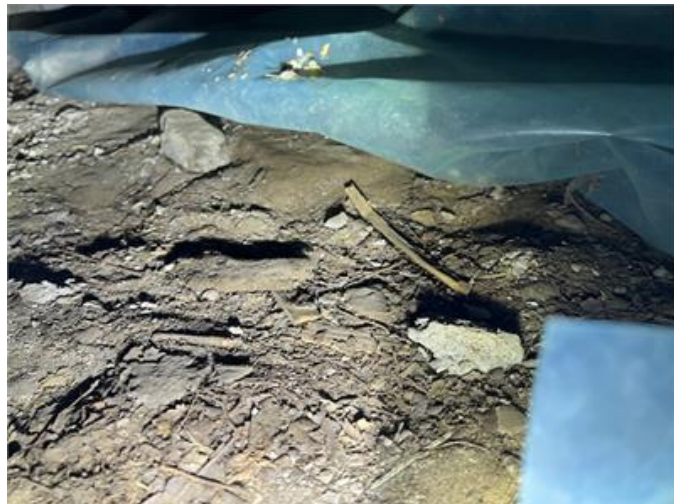
Pos 2. Organiskt material förekommer på markytan.