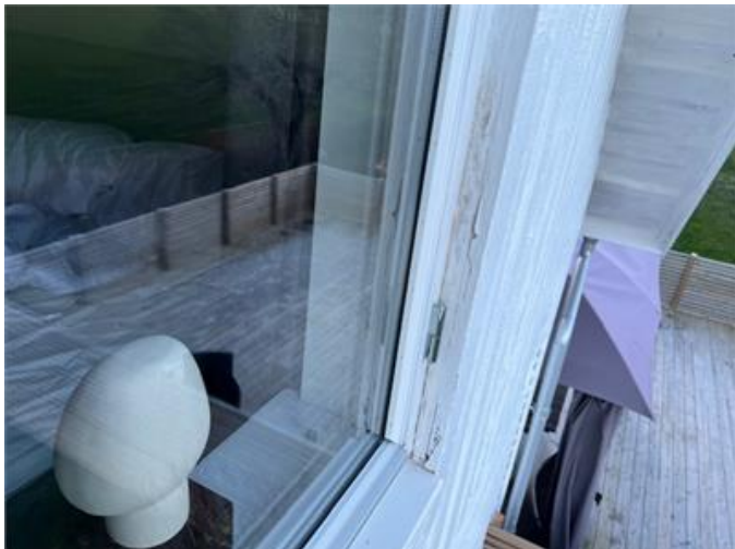
Pos 1. Lokala färgsläpp förekommer på fasadpanel.